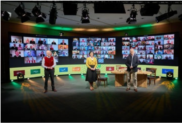
Siegerehrung ABHOF

Auszeichnungen für Direktvermarktungsbetriebe